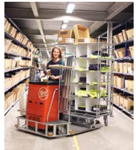
På Blåkläder är man mycket nöjd med lösningarna och produkterna från Helge Nyberg.